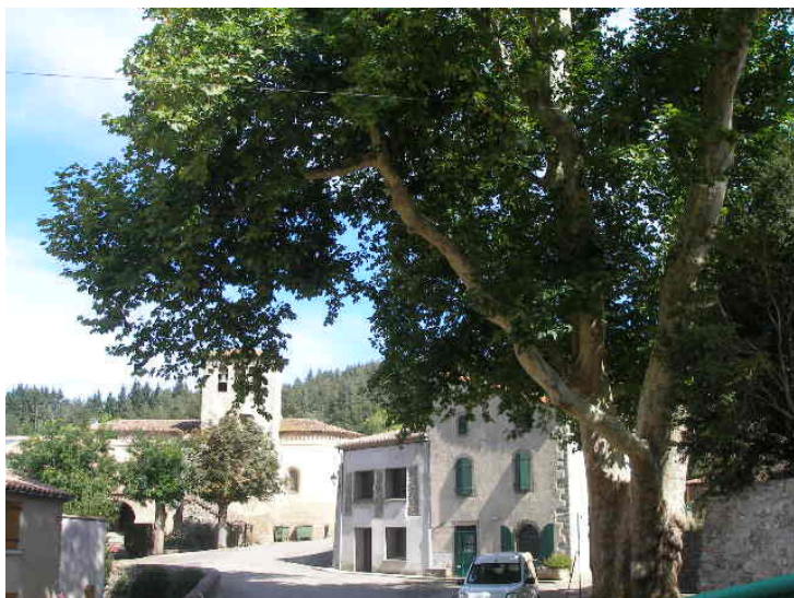
Le platane, au cœur du village, face à l'église (sept 2007)