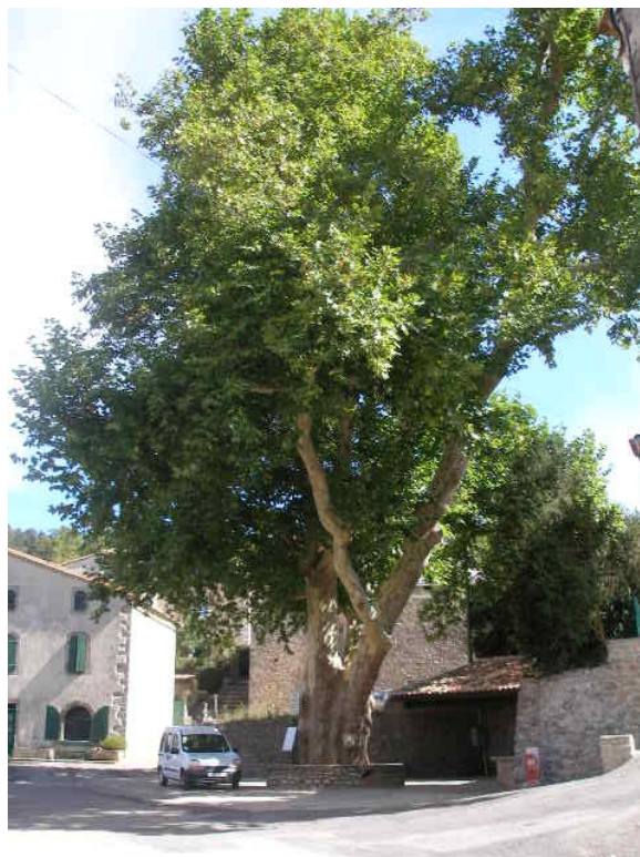
Le Platane majestueux sur la place publique de Villardebelle (sept 2007)

Le petit village de Villardebelle se situe à une vingtaine de kilomètres au Sud de Carcassonne, au cœur des Corbières. La place publique est ornée d'un magnifique platane atteignant 20 mètres de hauteur et protégé au titre des sites. Agé de plus de 200 ans, ce bel arbre est surnommé par les villageois « l'arbre de la Liberté », ou encore le « platane de la Révolution française ». Décoré de plusieurs plaques commémoratives de la Révolution, il rappelle chacun au devoir de mémoire. Une plaque évoque le classement du platane, l'autre une citation de Victor Hugo sur la Révolution.