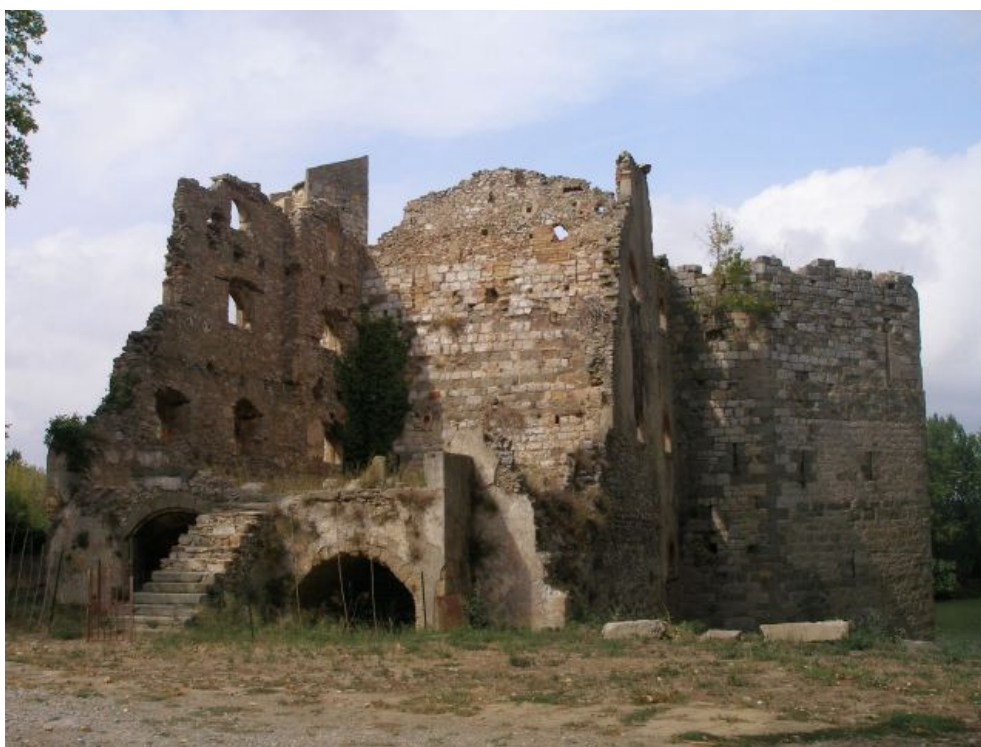
Le Moulin fortifié de Canet (septembre 2007)