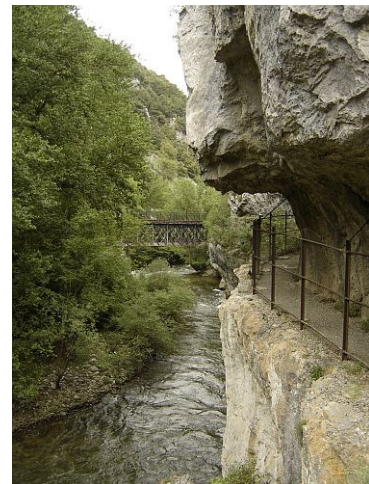
La voie taillée dans la corniche au XIX e siècle surplombe l'Aude (mai 2007).