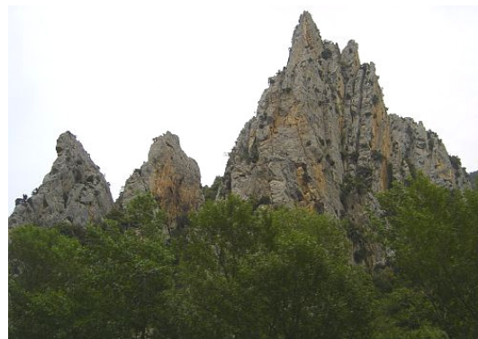
Les falaises du défilé se terminent parfois par des pics acérés (mai 2007).