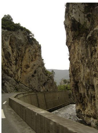
Aménagements réalisés pour le passage de la D117 dans le défilé de Pierre-Lys: murs de soutènement à gauche ; tunnel à droite (mai 2007).