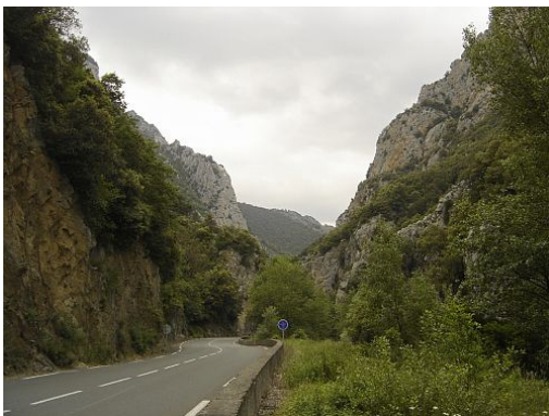
L'entrée du défilé de Pierre-Lys, côté amont (mai 2007).