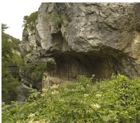
Première voie piétonne taillée dans la corniche à partir de 1814 (mai 2007).

http://grizzli.beat.free.fr/fer/trains/cathare/ap.htm