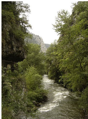
La rivière de l'Aude à l'entrée du défilé (mai 2007).