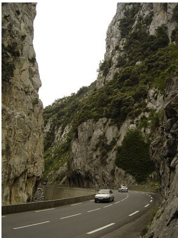
Passage de la D117 dans le défilé de Pierre-Lys (mai 2007).

La procédure de classement a également été mise en œuvre face à la menace d'un projet d'aménagement hydroélectrique, qui impliquait l'assèchement total des gorges de Pierre-Lys et la transformation du paysage.