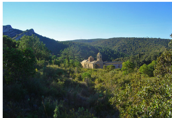
Au cœur de collines boisées, le clocher de l'abbaye de Fontfroide (janvier 2007).

Le périmètre classé protège l'environnement immédiat de l'abbaye mais ne couvre pas l'intégralité de l'unité paysagère formée par le massif forestier de Fontfroide. En effet ce massif s'étend sur plus de 3000 hectares et présente un grand intérêt paysager et écologique, dans une région à faible couverture forestière. La flore du massif de Fontfroide est l'une des plus intéressante des Corbières, elle abrite des espèces rares, et notamment une grande richesse et diversité des espèces de cistes.