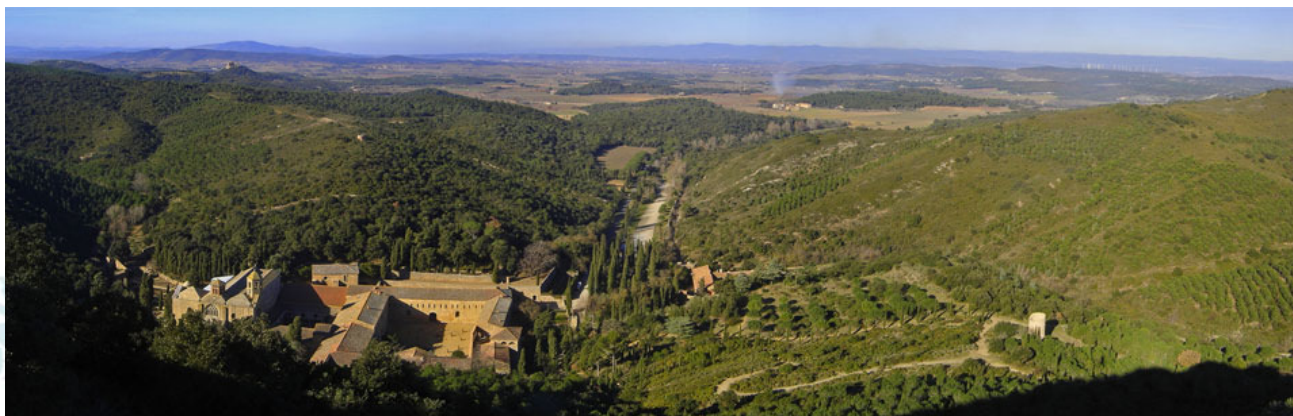
Vue panoramique depuis la croix de Fontfroide, en direction du Nord-Ouest (janvier 2007).