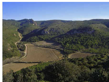
Le vignoble cultivé derrière l'abbaye (janvier 2007).