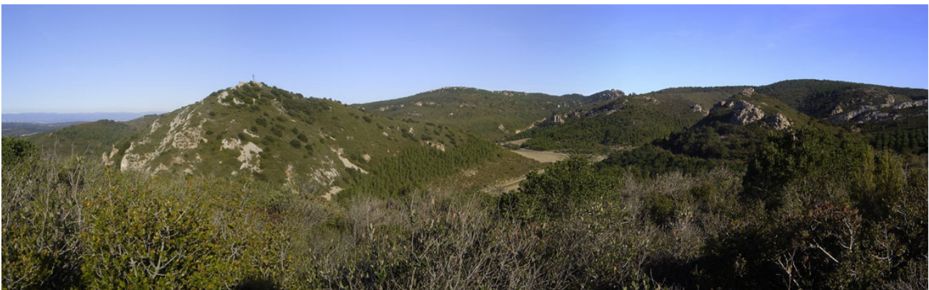
La colline de gauche porte la croix de Fontfroide (janvier 2007).

Un autre acteur amené à intervenir dans la gestion du massif de Fontfroide est le Parc Naturel Régional (PNR) de la Narbonnaise en Méditerranée. En effet le Massif de Fontfroide est une des unités paysagères comprise dans ce PNR qui s'étend sur 80 000 hectares. La sauvegarde, la valorisation et la réhabilitation du patrimoine paysager est un des axes de la « Charte du Parc ». Prochainement un « plan de paysage » sera établi pour chaque zone paysagère du territoire du Parc, dans ce cadre un observatoire photographique du paysage a été mis en place.