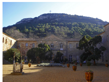
La cour de l'abbaye de Fontfroide (janvier 2007).

Le cloître a pour rôle de relier les principaux bâtiments du monument dont il est le centre. Ses galeries, voûtées sur croisées d'ogives, retombent sur des culs-de lampe ou des chapiteaux feuillagés. L'église abbatiale toujours construite sur le point le plus haut du monastère, respecte le plan traditionnel en forme de croix latine. Rythmée par cinq travées, la nef élève jusqu'à 20 mètres sa voûte en berceau brisé. Dans le collatéral sud s'ouvrent cinq chapelles datant du début du XIV e siècle. Construite entre 1180 et 1280, la salle capitulaire marie la sobriété et la majesté, la puissance et la légèreté.