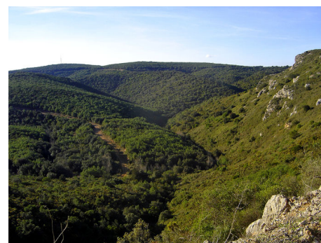
Paysage de collines et vallées étroites, caractéristique du massif de Fontfroide (janvier 2007).

Le paysage de l'abbaye et de ses abords a été bien préservé. Néanmoins le faciès de la végétation a été transformé depuis le classement par des incendies à répétition, notamment celui particulièrement grave de 1986. Le paysage végétal des collines entourant l'abbaye de Fontfroide est donc marqué par les reboisements de pins.