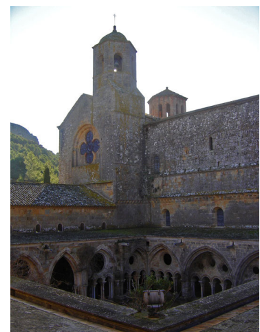
Clocher de l'église abbatiale et cloître de Fontfroide (janvier 2007).