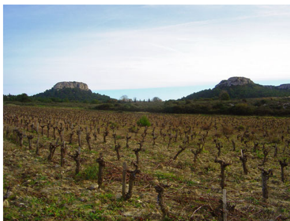
Sur la gauche le point culminant du massif de la Clape, le Pech Redon, (décembre 2006).