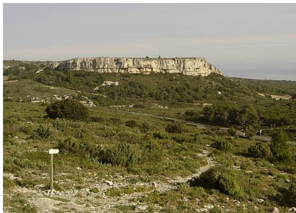
Plateau calcaire émergeant de la garrigue, vue depuis la route D168 (décembre 2006).