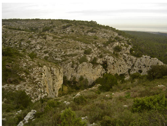
Garrigue sur plateau calcaire, aux alentours de La Vigie (décembre 2006).