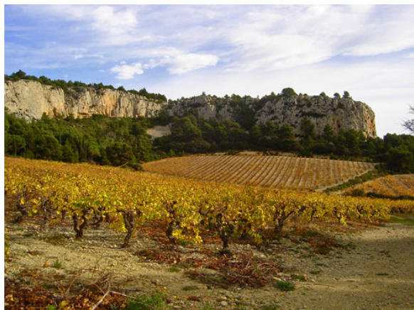
Vignobles bordés de bois et de falaises, au Sud du massif : un paysage caractéristique de la Clape (décembre 2006).

Le classement du massif de la Clape a par ailleurs été motivé par le schéma directeur d'aménagement du littoral languedocien (« Mission Racine »), qui préconisait la préservation d'espaces naturels à proximité de l'urbanisation touristique.