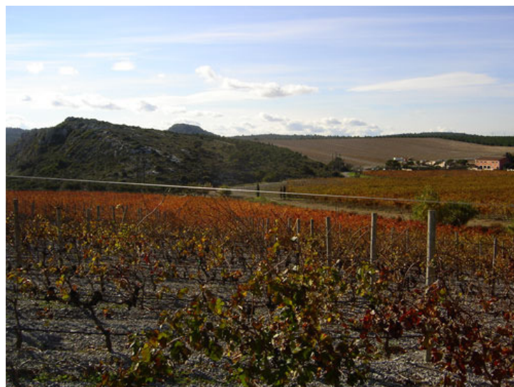
Vignes du domaine de l'Hospitalet, au fond on aperçoit le Pech Redon (décembre 2006).