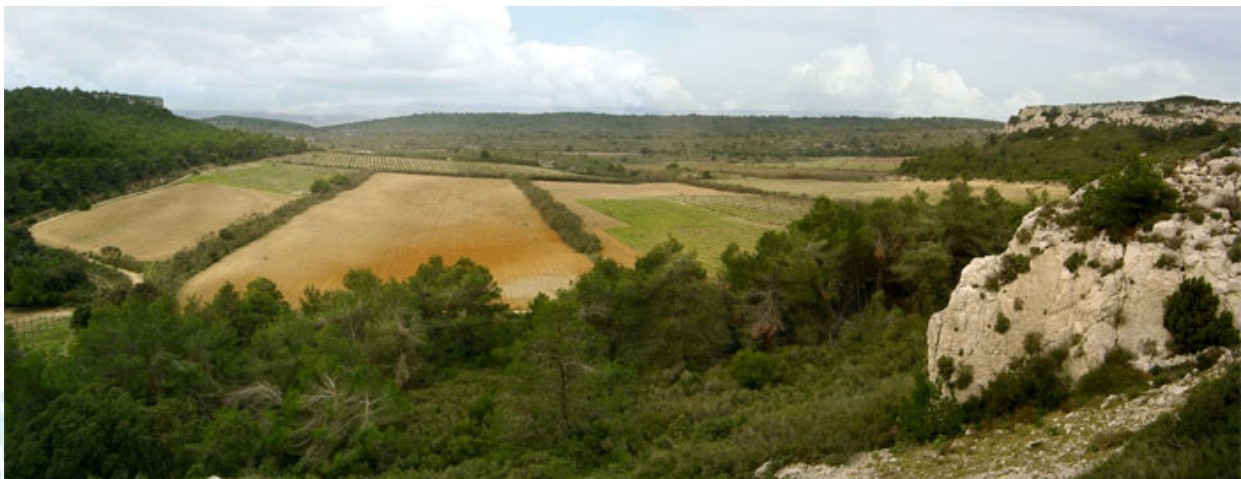
Alternance de parcelles agricoles, de bois, de garrigue et d'escarpements rocheux (décembre 2006).