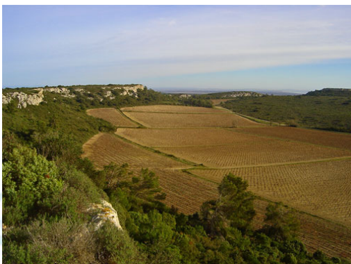
Vue depuis le plateau de la base militaire (décembre 2006).

- La Maison de la Clape à Vinassan est une association qui sensibilise le public à la préservation des écosystèmes et du patrimoine vernaculaire.