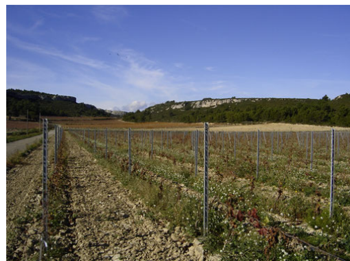
Vignes du domaine de Château Karantes (décembre 2006).