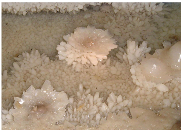
Fleurs minérales, dans le « gours aux nénuphars » (mai 2000).

Le classement au titre des sites vise à conserver en meilleur état possible le patrimoine géologique de l'Aguzou. La protection concerne le sous-sol et le sol sur la quasi-totalité de la montagne de l'Aguzou, afin de tenir compte de l'ensemble du système hydrogéologique. En effet toutes les modifications apportées à la surface du sol ou dans les galeries de la cavité peuvent avoir une incidence sur le cheminement de l'eau dans le karst et donc sur la formation et la conservation des concrétions.