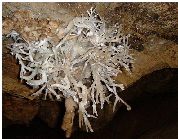
Bouquet d'aragonite coralloïde (mai 2000).