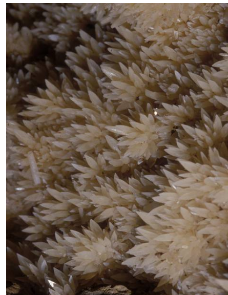
Cristaux de type scalénoèdre formés dans un gour (février 2004).

http://www.ecologie.gouv.fr/IMG/pdf/dossier_presse_grottes.pdf