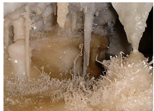
Stalactites et excentriques de calcite, salle des Mille et Une Nuits (mai 2000).

Des visites proposées sous forme de safari-souterrain (un groupe d'une dizaine de personnes passe la journée sous terre accompagnée de guides). Cette activité reçoit 900 à 1000 personnes par an.