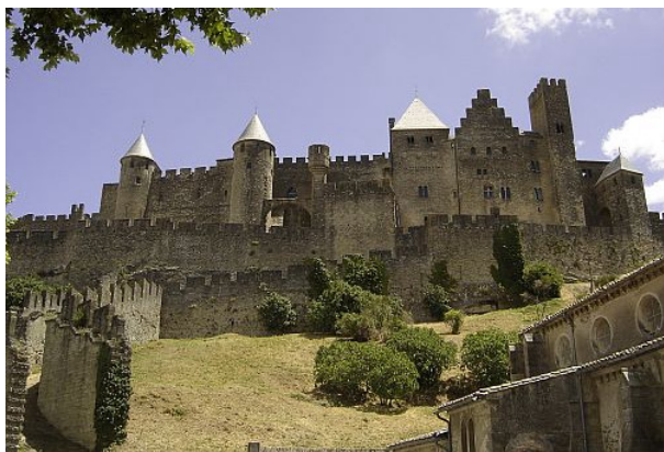
Versant Ouest de la cité de Carcassonne, patrimoine architectural et historique exceptionnel (juillet 2005).