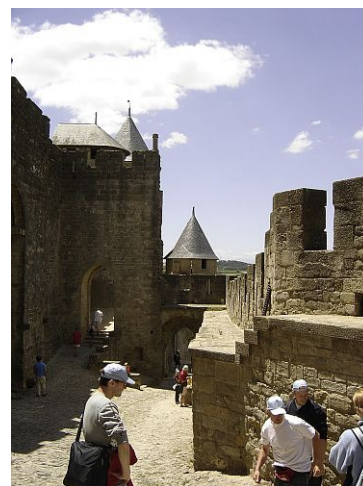
La promenade le long des remparts est très fréquentée (juillet 2005).