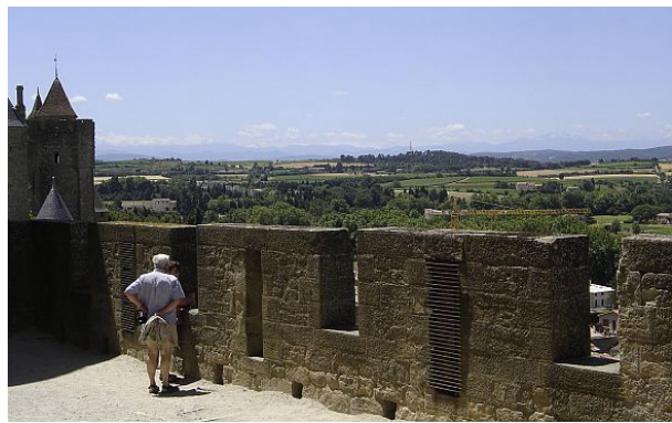
Vue depuis la cité de Carcassonne sur les espaces agricoles au Sud (juillet 2005).