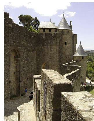
Fortifications de la cité (juillet 2005).

Actuellement le secteur agricole du site classé est concerné par des projets de création de bassins de rétention, ils devront faire l'objet d'une réflexion préalable pour une bonne insertion paysagère.