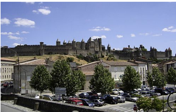
Les remparts de la cité de Carcassonne vus depuis le Pont Vieux sur l'Aude (juillet 2005).

Le classement du site des abords de la cité de Carcassonne a été motivé pour son caractère historique et pittoresque. L'objectif est de préserver le glacis immédiat de la cité médiévale et son écrin paysager côté Sud-Est de vignes, champs et bois. La relation « paysage-monument » est essentielle à Carcassonne car elle est porteuse de l'ambiance générale du site.