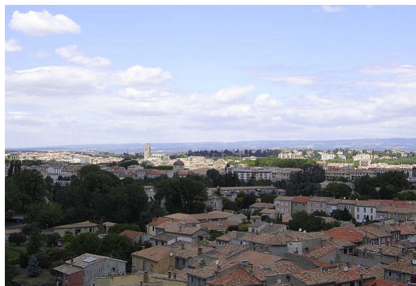
Vue depuis la cité sur la ville de Carcassonne, en direction de l'Ouest (juillet 2005).